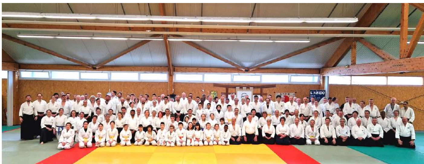
Stage à la Mémoire de Maître Nocquet à Yerres (91) le 19 mars 2023

Thierry GEOFFROY - juillet 2023 Tel: 06 81 11 05 60 | mail: th_geoffroy@yahoo.fr