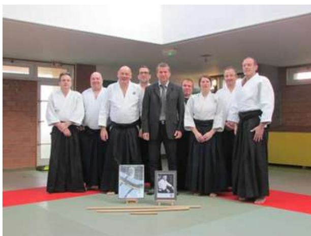
10.01.2015 cérémonie d'ouverture