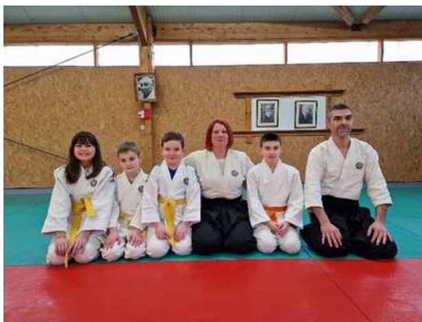
28.01.2023 participation à la journée jeunes du GHAAN

En tant qu'enseignante, je suis fière de mes élèves ; ma plus belle récompense est de les retrouver à chaque cours avec le sourire et l'envie de progresser. Ils participent bien volontiers aux diverses manifestations proposées (stages, forums, démonstrations etc...).